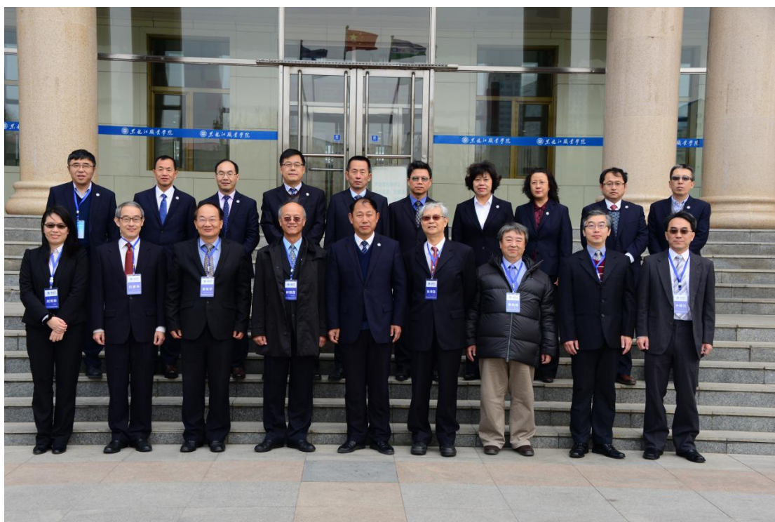
IEET 专家组到黑龙江职业学院考察评估

中华工程教育学会（IEET）认证委员会官方公布 2018 年全球技术教育专业认证结果，黑龙江职业学院计算机网络技术、数控技术专业正式通过悉尼协议（Sydney Accord,缩写为 TAC-AD）认证。这标志学校高水平高职院校建设再上新台阶，国际化专业建设及技术教育人才培养质量取得重大突破，也是学校积极推动 OBE 教育教学改革工作的又一标志性成果。黑龙江职业学院成为我省首个通过悉尼协议认证的院校，这两个专业也是目前省内首批且仅有的两个通过认证的专业。